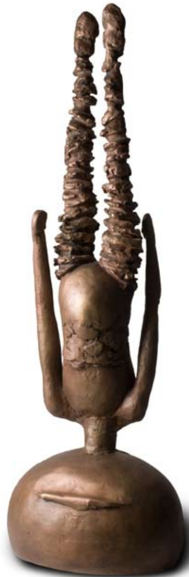
ELÄMÄ PÄÄLÄELLÄN, 2008, pronssi, 158 x 50 x 39 cm

Ilmaisussaan Korhonen on irrottautunut reippaasti sekä klassiselle että modernille taiteelle tyypillisestä idealisoivasta muodonannosta. Modernia veistotaidetta uudelleentulkinneen Rosalind Kraussin mukaan ”moderni veistotaide syntyi klassisesta arkeologiasta”, siis siitä haltioitumisesta, minkä taiteilijat kokivat antiikin veistosfragmenttien edessä. Esimerkiksi Constantin Brancusin sulavalinjaiset hahmot on helppo yhdistää kädettömien ja jalattomien torsolöytöjen myötä syntyneeseen kauneusihanteeseen.