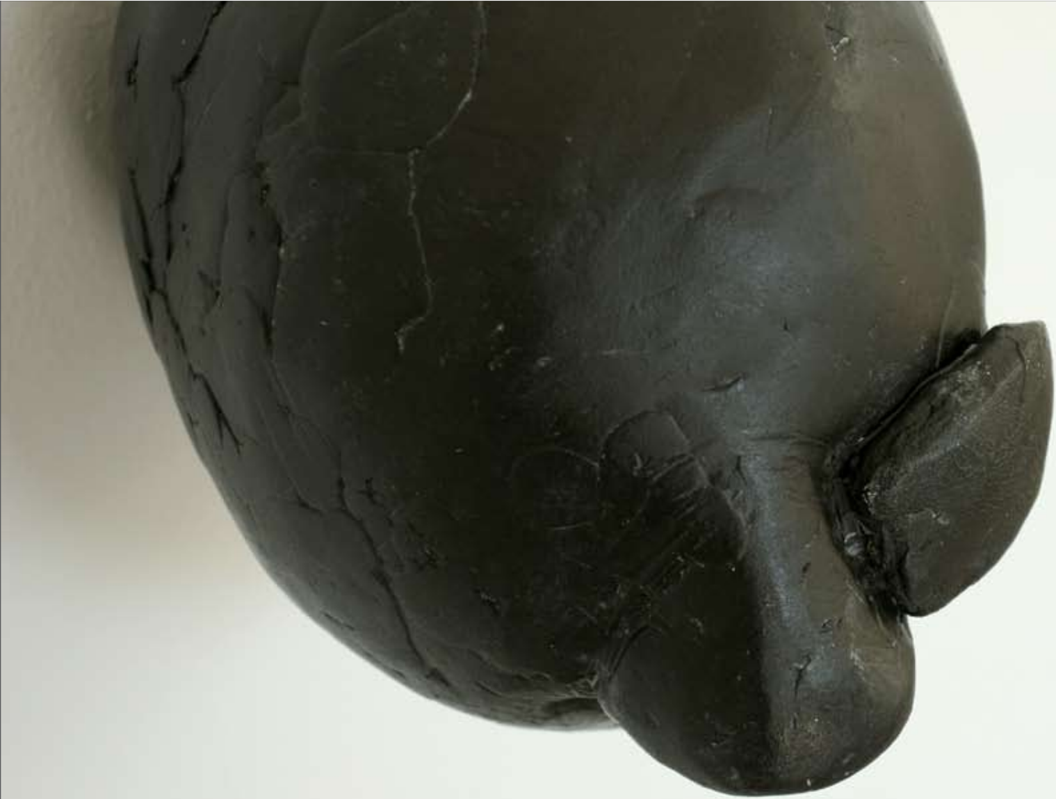
HAJU, 2006, lasikuitu, 20 x 18 x 20 cm