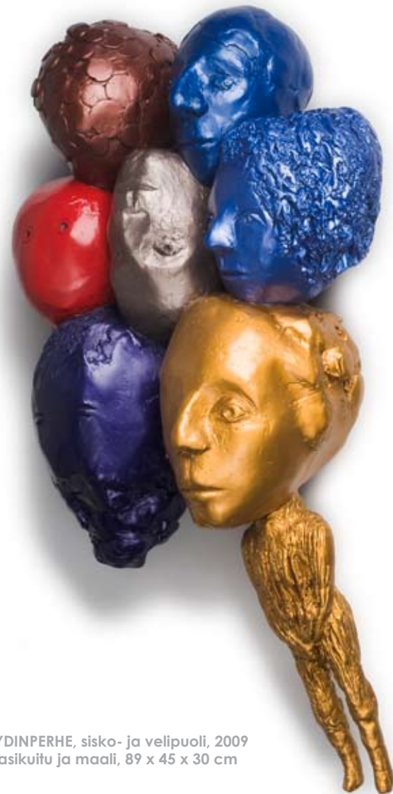
YDINPERHE, sisko- ja velipuoli, 2009 lasikuitu ja maali, 89 x 45 x 30 cm