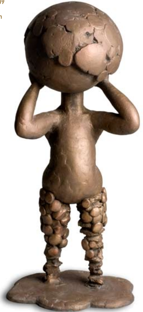
PALLOPÄÄ, 2009 pronssi 90 x 40 x 57 cm

“Työhuone edustaa hiljaisuutta, hiljaista ajattelua, hiljaisuudessa oloa. Se on tila, jossa ei ole esteitä. Olen omien ajatusteni instrumentti” - Marjukka Korhonen