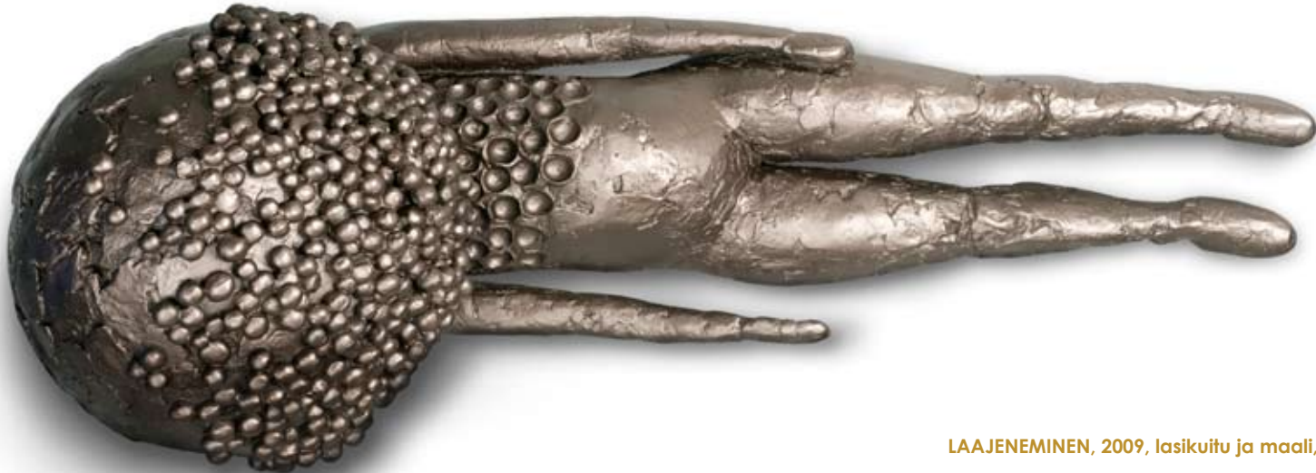
LAAJENEMINEN, 2009, lasikuitu ja maali, 44 x 122 x 55 cm

Kahdessa Pallopää-veistoksessa lapsen hahmo on tunnistettavissa